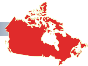
Figure 1 : Collectivités participantes 9